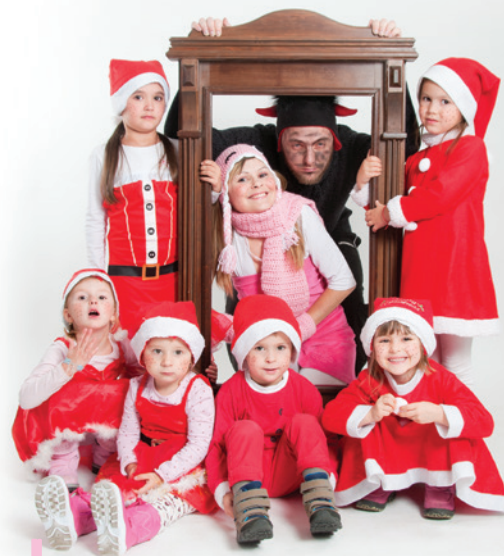
Dorotka sa deťom prihovára prostredníctvom rôznych bábok, rozprávok. Deťom je veľmi blízka.

„Ráno, v deň termínu, som bola v pôrodnici na vyšetrení, sestrička pozerala na záznam a povedala mi, že mám kontrakcie každých 8 minút.“