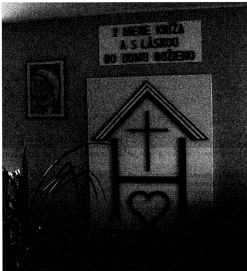
Vstupná hala v prvom slovenskom hospici v Bardejovskej Novej Vsi