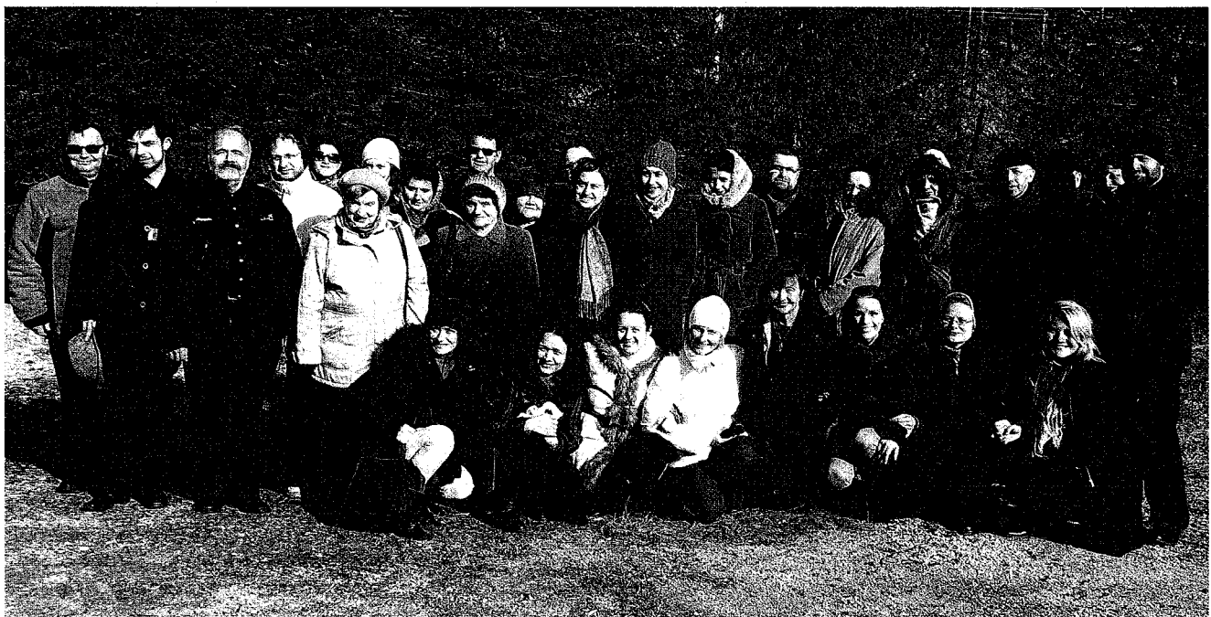
Účastníci seminára počas prednášok o kreatívnom sprevádzaní smútiacich

Z prechádzky v prírode rehoľná sestrička doniesla snežienku. Druhá účastníčka, príslušníčka Evanjelickej a.v. cirkvi priniesla zase v malom pohári vodu z neďalekého potoka. Všetkým