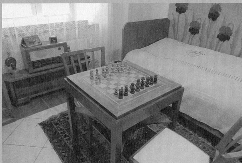
Židovská izba z prelomu 18. a 19. storočia, múzeum v Osvienčime.

angličtina, poľština a slovenčina) a pozostávajúcu z viacerých náboženstiev (Evanjelici a.v., Pravoslávni, Gréckokatolíci, Rímskokatolíci a dokonca Židia).