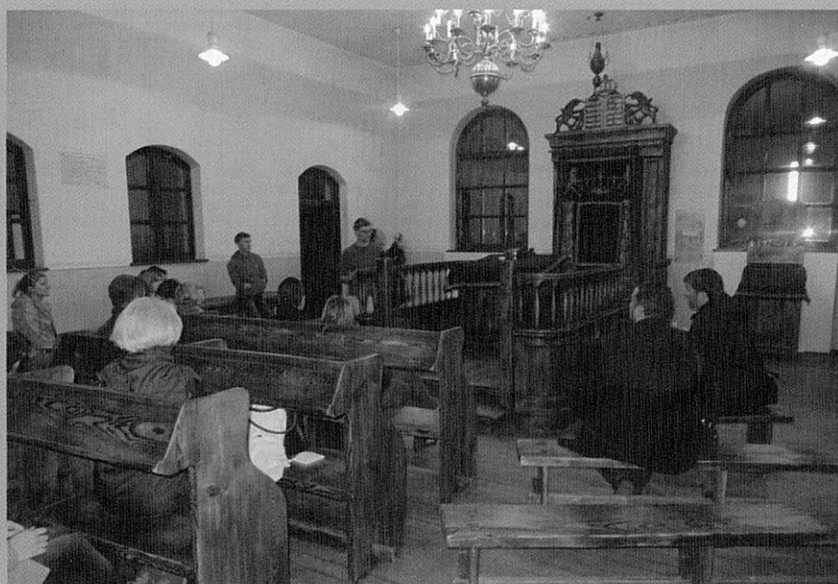
Účastníci projektu v jedinej zrekonštruovanej synagóge v Osvienčime.

Židovská štvrť Kazimierz v Krakove, židovská Isaacova synagóga a židovský cintorín v Krakove či ďalšie historické miesta, spojené s udalosťami Druhej svetovej vojny, niesli aj dnes akýsi neopísateľný nádych smútku... Mohli sme si to uvedomiť aj v kedysi najbohatšie vyzdobenej